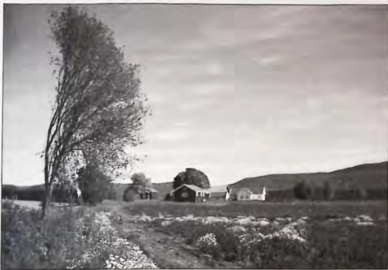
Bjørnstad i Steinsfjeringen.