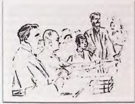
Aftenposten, 8. januar 1929.