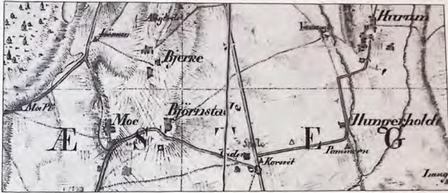
Rektangelkart 1827. Statens kartverk.