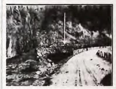
Dette bildet fra Grøterudberget har også en pil som viser hvor de nedgravde pengene skal befinne seg.