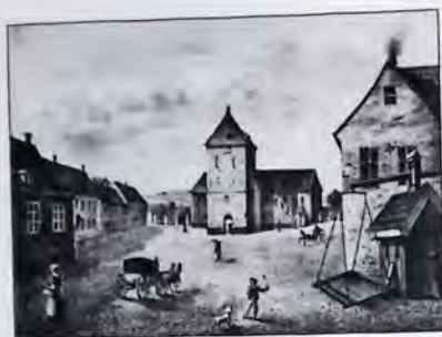
Fra Stortorget i Christiania. Maleri av Peter Frederik Wergmann (1830).