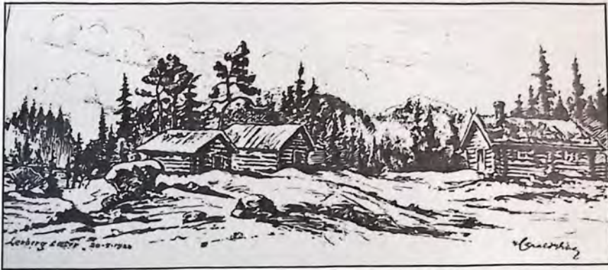
Lerbergsetra. Tegning av Harald Wibe. Fra Ringerike (1936).

pratet og håpet på så mange abbor at vi fikk til en panne da vi kom frem til setra.