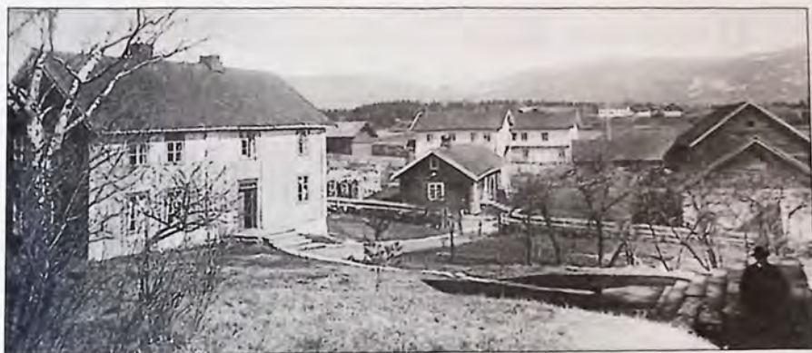
Ner-Nigarden Hårum i 1930-årene.