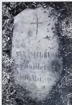
Gravsteinen på Ner-Nigarden Hårum i Hole. Se også bladets forside.

Steinen er etter all sannsynlighet nedsatt på Hole kirkegård i 1859. Ved Anders' død i 1882 kan steinen være tatt ned for å sette på hans