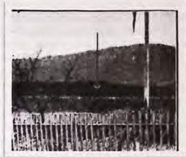
Dette fotografiet fra Kråkeberget er påført en pil som viser hvor pengene skal ha vært gravd ned.