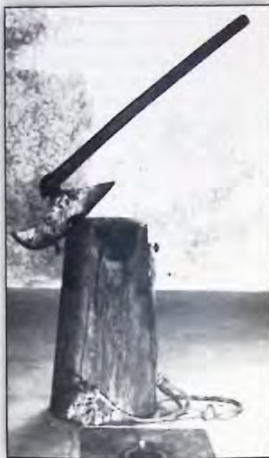
Christian 5.s Norske Lov krevde dødsstraff ved halshogging for letfærdige kvinnfolk.