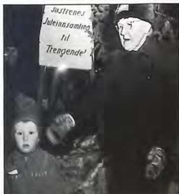
Ved julegryta på toget i Hønefoss.

Dette fortsatte hun med til hun ble så skrøpelig at hun ikke orket mer.