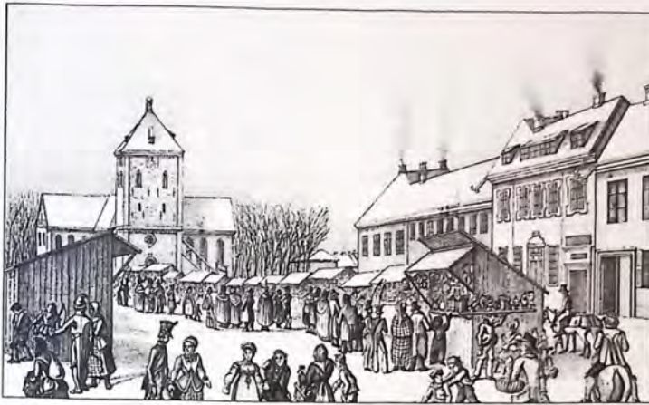
Christiania marked rundt 1830.