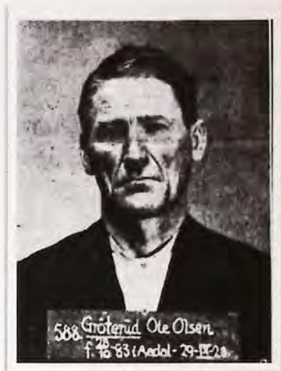
Fotografi gjengitt i Aftenposten, 1. oktober 1928.

Politiet holder på med undersøkelser helt frem til klokken halv fire natt til torsdag. De har blant annet gått ombord i hvalfangerskuten Heetoria , som onsdag skulle ha gått ut fra Tønsberg. Det er kommet opplysninger om at Ole tidligere har vært med på hvalfangst.