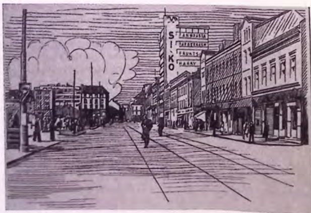
Mange ringerikinger flyttet til Grønland i Oslo.