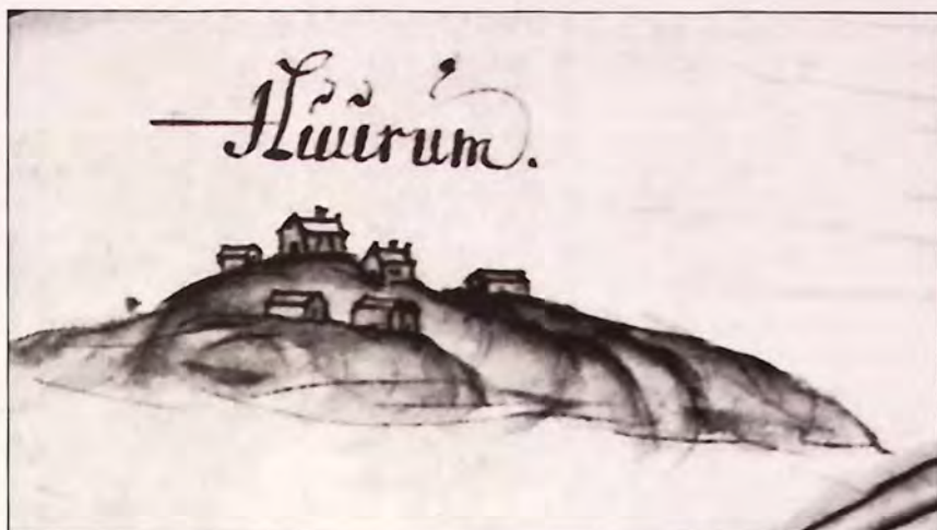
Den eldste avbildning av Hårumsgårdene, slik de framkommer på 1707-kartet. Tegningen viser nedre del av Hårumsåsen, men gir nok et noe forenklet bilde.