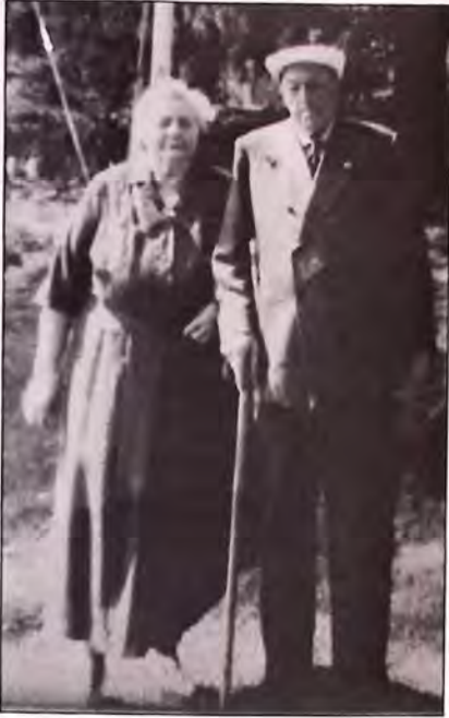
Mormor og bestefar.

oss jenter. Det var sterk kontrast å se hvite florte brudekjoler i en bakgård full av store grå murvegger. Jeg kan ikke huske om jeg var der inne selv, men jeg husker noen ungjenter som skulle prøve sin første brudekjole. Underholdende var det i hvert fall.