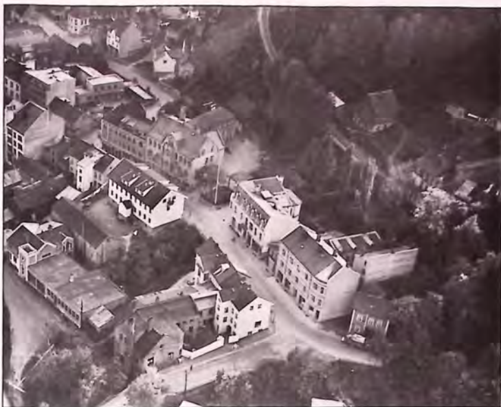
Stabells gate i 1951.

trillepiker. Det hendte også at det utspant seg litt dramatik, både på den ene og den andre måten. Som da antallet villkatter var blitt altfor stort i gården. Det var en sterk opplevelse for små barn å sitte i trappeoppgangen og oppleve at kattunger ble skutt. Men slik ble det altså gjort den gangen. Kattene var en plage, og i neste omgang en helsefare.