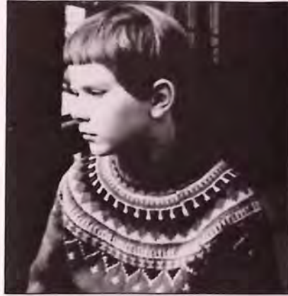
Artikkelforfatteren i åtteårsalderen, sittende i bakgården på balkongen til mormor.

Gården vår var et levende sted å bo i som barn. Vi utfoldet oss fra kjeller til loft, og fra forside til bakgård. Det var kroker å gjemme seg i, og trange smug. Her kunne vi risikere å møte på en eller annen fyllik, som vi kalte dem, og da ble vi veldig redde. Det hendte ikke så rent sjeldent at vi gjorde det. Den gangen var disse karene ganske harmløse, men likevel skumle ut fra et barns synspunkt. Og et sted vi i hvert fall ikke fikk lov å gå, var "Lassaronparken". Navnet taler jo for seg. Parken lå i en