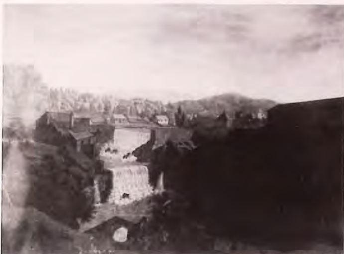
Bærums verk. Avfotografert kobberstikk.

Krigslykken hadde nå definitivt forlatt svenskene. De ble ytterligere svekket 23. april, da de tapte et slag om Moss. Dansk-norske krigsskip kom opp Oslofjorden, og 29. april brøt de svenske styrkene opp fra Christiania, trakk seg sørover og krysset Glomma. To måneder senere inntok de Frederikshald, der borgerne satte fyr på byen - lederne var brødrene Peder og Hans Colbjørnsen, Anna Colbjørnsdatters halvbrødre. Kort tid etter kom Tordenskjold til Dynekilen og erobret den svenske transportflåten, der artilleriet befant seg. Karl 12. hadde nå ikke annet valg enn å dra tilbake over grensen.