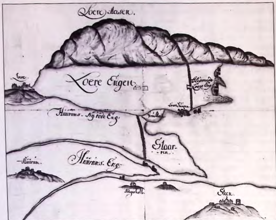
I forbindelse med rettsaken ble det i 1707 tegnet et kart over Hårumsgårdene, Lore og Stein.