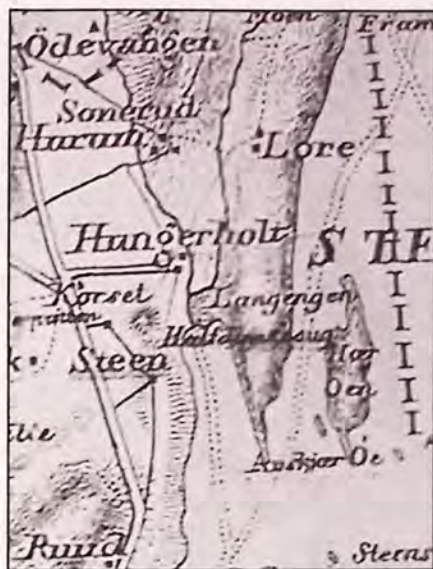
Lommekart over den meest besøgte Deel af Ringerige (1846) - utsnitt.