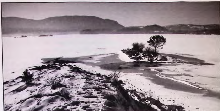
Grufseskjæret - i dag Loretangskjæret.