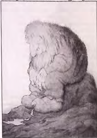
«Trollet som grunner på hvor gammelt det er», malt av Theodor Kittelsen (1911).