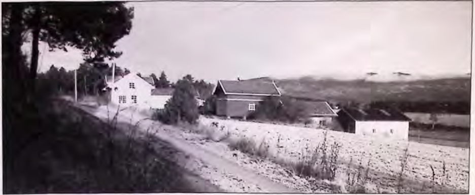
Østigarden Hårum i dag.

like etter 1670. Han er trolig identisk med Christen Hårum som nevnes i slutten av 1670-årene og fram til 1684, da han i en gjeldssak kalles Christen Nilsen Hårum, men av en eller annen grunn er stevnet til Tanberg tingstue i Norderhov. 29