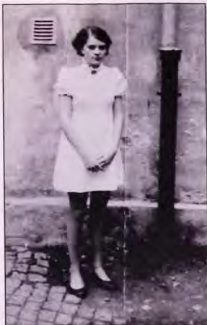
Konfirmant i 1969, fotografert i bakgården.

på stjernene. Utsikten var det heller ikke noe å si på. Hønefoss og omegn lå foran oss. Det var spennende!